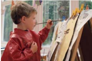
La future structure accueillera entre 25 et 30 enfants.

En matière de garde de jeunes enfants, la communauté de communes des Coteaux de Bellevue mène une politique offensive.