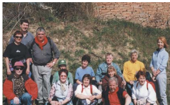
Chaque année en juin, l'association organise une randonnée sur le chemin de Poutou. L'année dernière, 150 marcheurs ont suivi le mouvement.